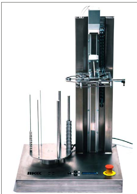
Prototyp des Lagersystems aus der ursprünglichen Semesterarbeit.

Aus den Konzeptskizzen wird in der Phase Entwerfen ein CAD-Modell der gesamten Anlage erstellt. Nach dem ersten Entwurf, in welchem die Anlage grob modelliert