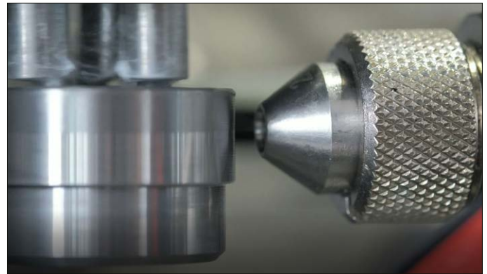
Mantelauftrag eines Primers mittels Signierpistole.

die Nutzlast des Greifers, als auch die Randschärfe, Genauigkeit und Schichtdicke der Beschichtung geprüft. Die Qualität der Beschichtungen und die Effizienz des Prozesses sind sehr gut. Die Details zur Leistung der Anlage sind im folgenden Absatz beschrieben.