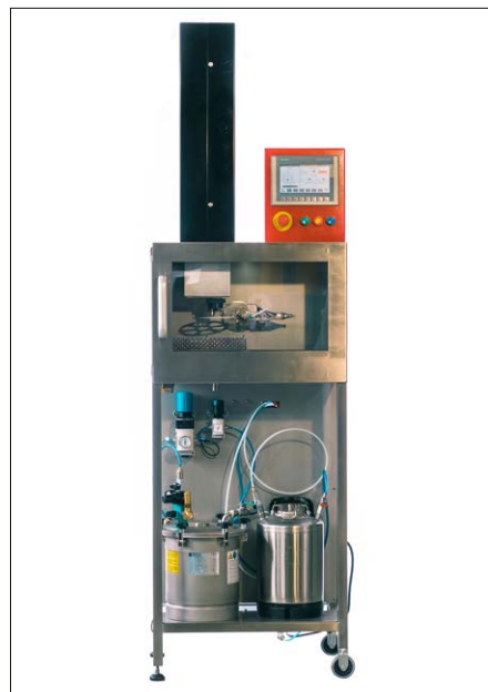
Prototyp der Anlage für den Primerauftrag aus der aktuellen Bachelorarbeit.

Die Steuerung der einzelnen mechatronischen Systeme wird über einen Arduino