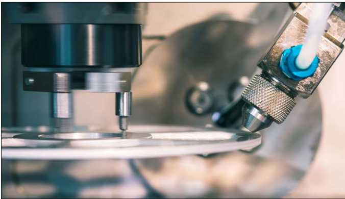
Stirnseitiger Auftrag eines Primers mittels Signierpistole.